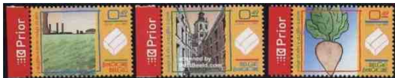
Toen de handel in rietsuiker door de Franse Revolutie in het slop raakte, bleek het sap uit bieten een waardig alternatief.