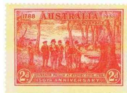
Boven: Eén van de zegels uit een serie van drie, uit 1938 voor de 150e verjaardag van de eerste nederzetting in New South Wales. Alle postzegels hadden hetzelfde ontwerp met de landing p Sydney Cove op 26 januari 1788.

Vanaf het begin waren postzegels een politiek medium. Toen ze voor het eerst verschenen, was labour aan de macht, vandaar het nationaal motief van de kangoeroe op een kaart van het land (8). Toen de conservatieven aan het bewind kwamen, maakte de kangoeroe plaats voor een portret van de koning (9). Toen labour weer terugkeerde, verscheen de kangoeroe weer. Dat ging zo door in de jaren '20 en '30. De 6d-postzegels uit 1914 met de kookaburra was minder controversieel. Speciale uitgiften, die vanaf 1927 onregelmatig verschenen, markeerden de inwijding van het federale parlement in Canberra en de Sydney Harbour Bridge (11). Het trio voor het zilveren jubileum van George V laat